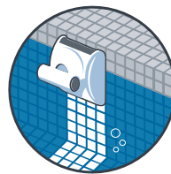
Reinigung der Wasserlinie