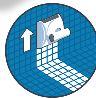
Reinigung des Bodens und der Wände