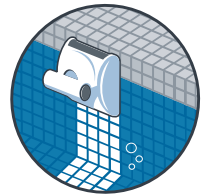
Reinigung der Wasserlinie